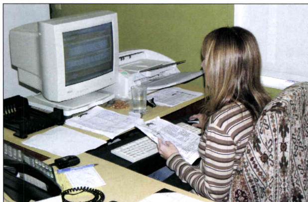
Le travail de la répartition s'est grandement simplifié avec l'introduction de Solution Gestion Transport (SGT).