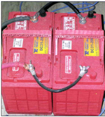
Le système d'urgence est alimenté par des batteries qui peuvent procurer une autonomie de trois à quatre heures.

de programmation et de développement de logiciels.